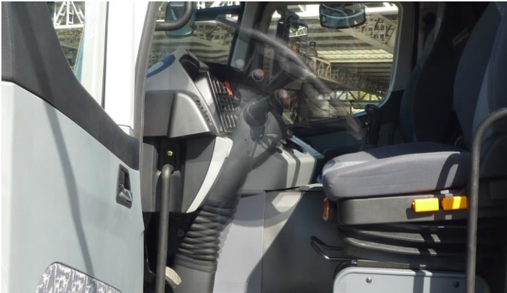
Cabina ergonómica con volante ajustable